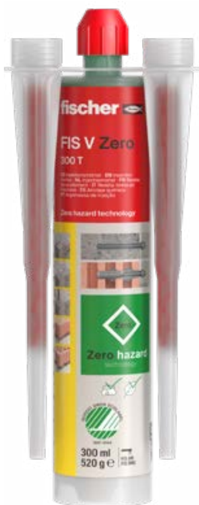
FIS V Zero 300 T